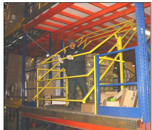
Exemple d'utilisation dans un entrepôt frigorifique à 3 niveaux.